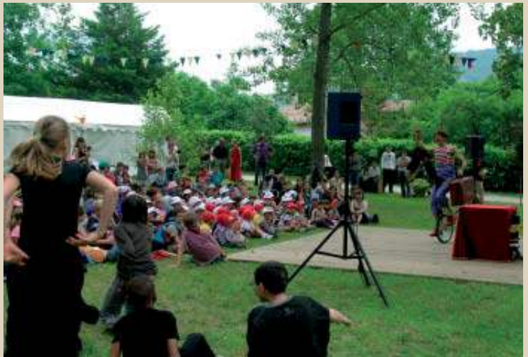
... toujours un succès.