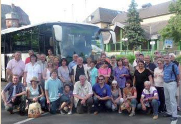
La délégation de Saint-Péray à Groß-Umstadt.