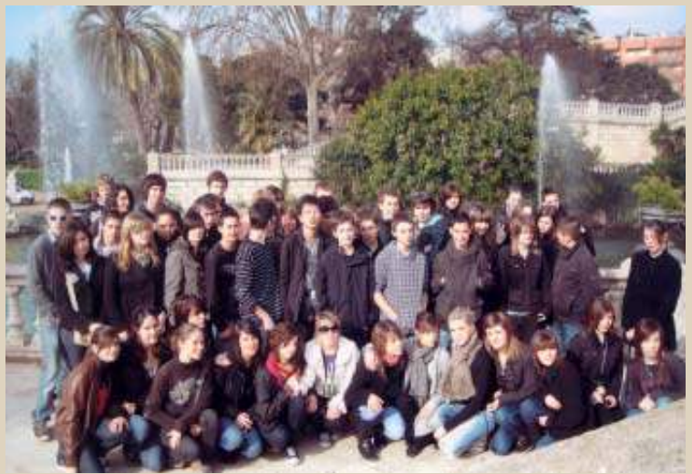
Collège de Crussol : sous le soleil de Barcelonne.