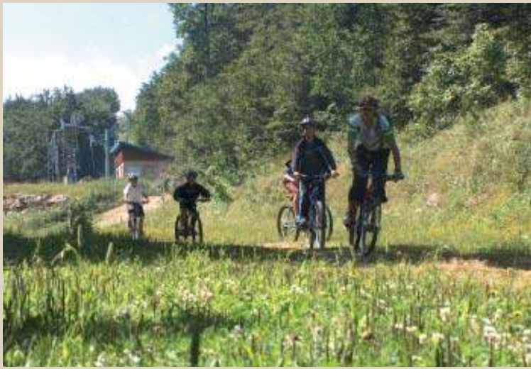
Sac... Ados : le plein d'activités.