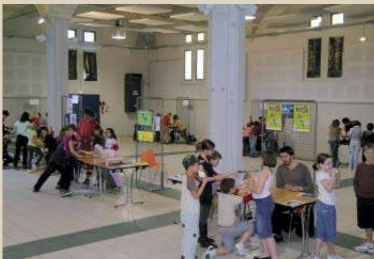
Les rencontres sciences au CEP du Prieuré...