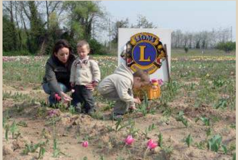
Opérations 100 000 tulipes : 13 200 € récoltés par le Lions Club.