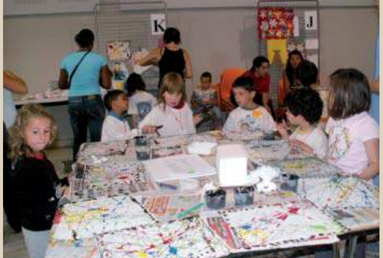
Journée des Arts Visuels au CEP du Prieuré.