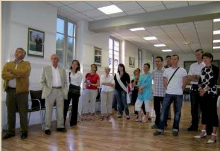
Macadam 07 et la Ville de Saint-Péray, partenaires pour la Ronde de Crussol.