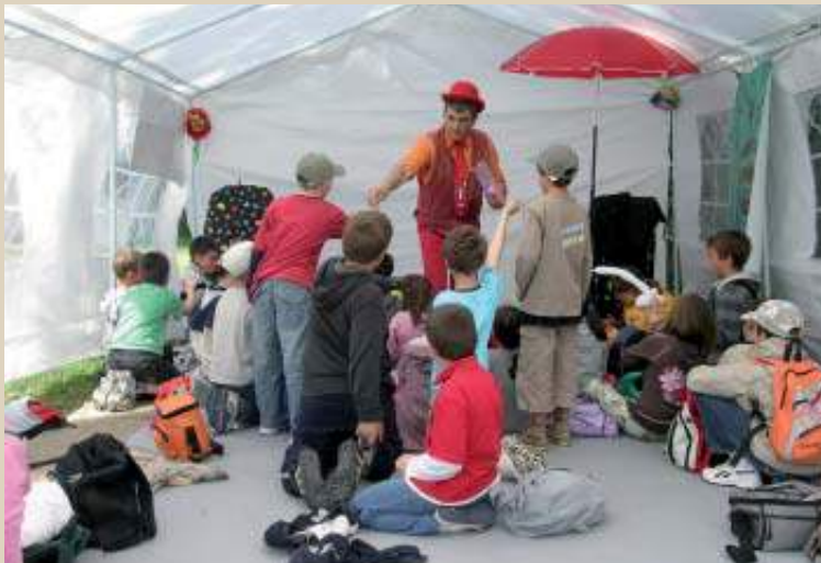
Festival «L'Enfance de l'Art» 8 ème édition...