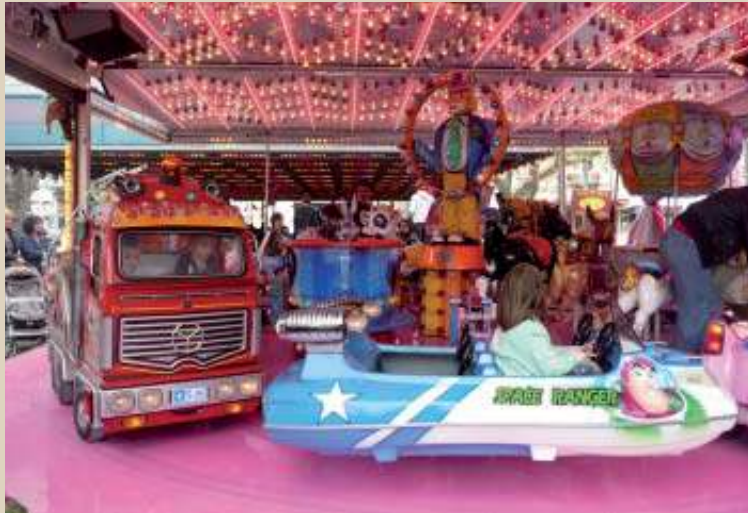
Vogue de Pâques : tournez manèges.