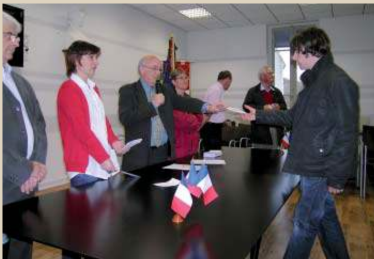
Cérémonie de la citoyenneté.