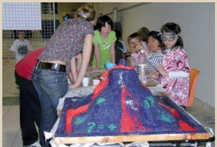
... et ses scientifiques en herbe.