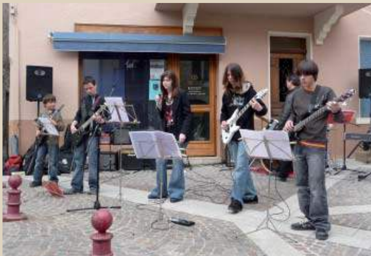
Pogne et vin blanc en musique : les élèves de l'école de musique.