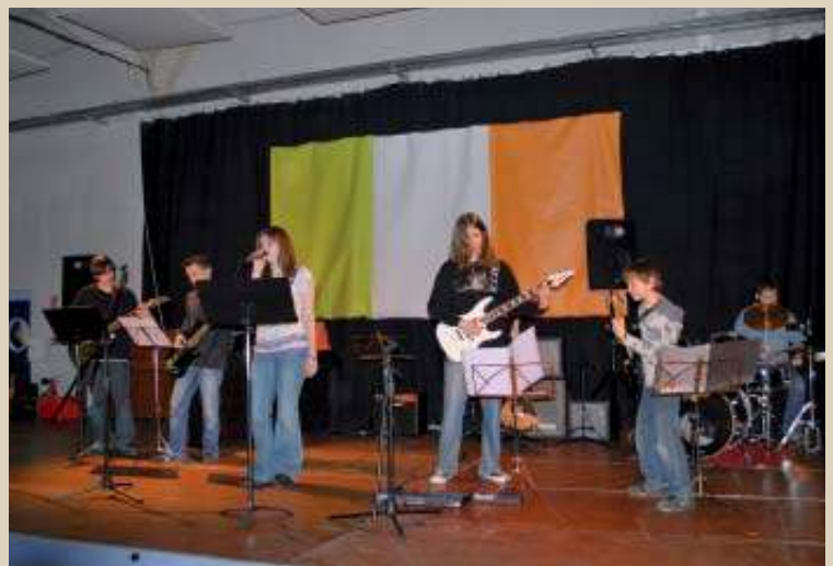
Soirée irlandaise au CEP du Prieuré avec l'école de musique.